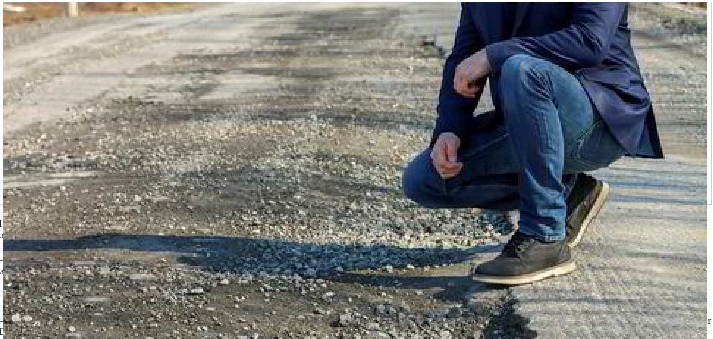
På denne veien skal sjømat for millionbeløp fraktes – politikker ber regjeringen ta grep.